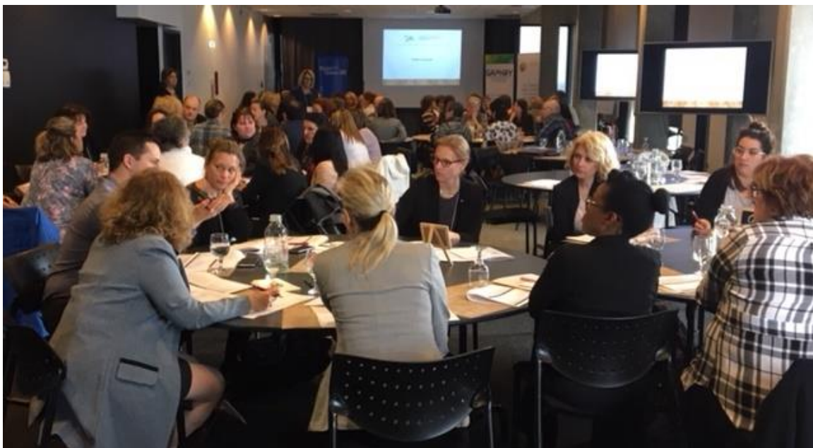
Groupe de travail lors de notre journée sur la mobilité pour tous