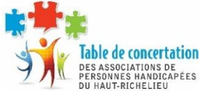
TABLE DE CONCERTATION DES ASSOCIATIONS DES PERSONNES HANDICAPÉES RÉGION HAUT-RICHELIEU